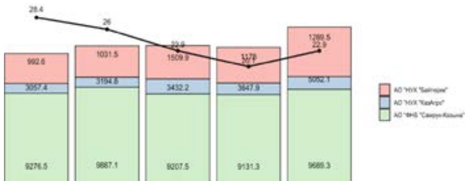
Рисунок 3. Динамика долга субъектов квазигосударственного сектора за 2016-2020 годы

США) в 2019 году до 7 016,8 млрд. тенге (16,7 млрд. долл. США) в 2020 году. В соотношении к ВВП долг квазигоссектора увеличился до 22,9% в 2020 году при 20,3% в 2019 году.