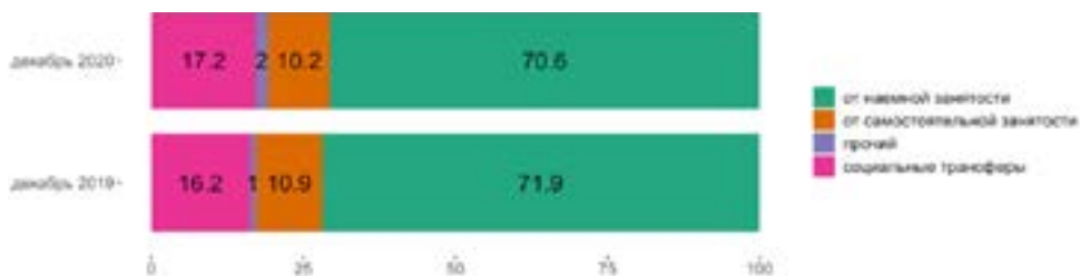
Рисунок 1. Структура номинальных денежных доходов населения

Данный факт свидетельствует о значительном ухудшении ситуации на рынке труда, что вынуждает население обращаться за помощью к государству.