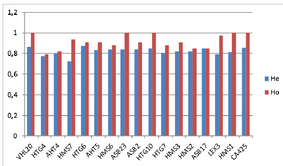
Figure 2 – A share of informative and effective alleles in 17 MS loci of the Kazakh horses of the Aday offspring. The dark colour specifies a share of informative alleles, the light one - a share of effective alleles

Level of the average expected heterozygosity of horses in loci varies from 0.7235 (in HMS7 locus) to 0.8695 (in HTG6), the average value on all loci is 0.8226. This regularity is observed also in levels of average observed heterozygosity as it is specified in figure 2.