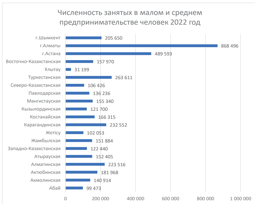
Рисунок 2 - Численность занятых в малом и среднем предпринимательстве за 2022 год

Самый высокий процент числа занятых в малом и среднем предпринимательстве отмечается в городе Алматы (16,74 %), за которым следуют город Астана (9,42 %) и Туркестанская область (5,08 %).