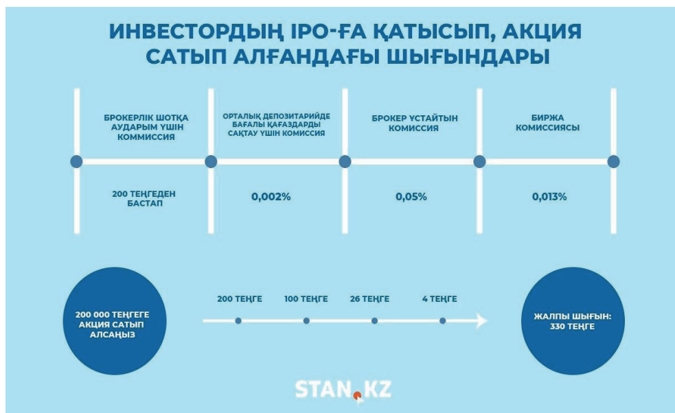
1-сурет – Инвестор шығындары

Дегенмен IPO бағдарламасы бойынша акцияларды сатып алу кезінде брокер бағалы қағаздардың жалпы сомасынан комиссия ұстайды. Бұл комиссияның мөлшері брокерлік ұйымдарда әртүрлі болуы мүмкін.