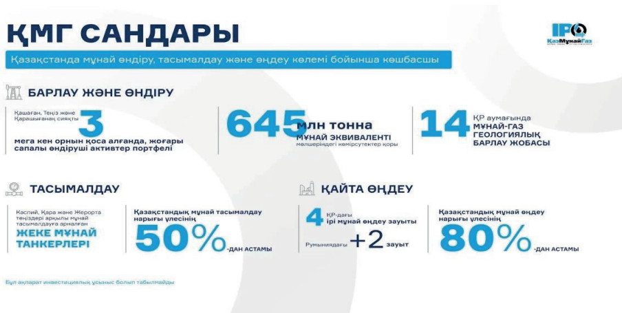
2-сурет. ҚМГ көрсеткіштері

ҚазМұнайГаз активтерінің құны 32,2 млрд.. көмірсутек қорларының көлемі-645 млн тонна мұнай баламасы. Қазіргі уақытта компания бизнесті белсенді дамытуда. Мәселен, батыс ұйымдарымен бірлесіп ірі өндіруші жобаларда мұнай өндіруді ұлғайту бойынша жұмыс жүргізілуде, жаңа кәсіпорындарды пайдалануға беру жоспарланған (Жуков, 2010)