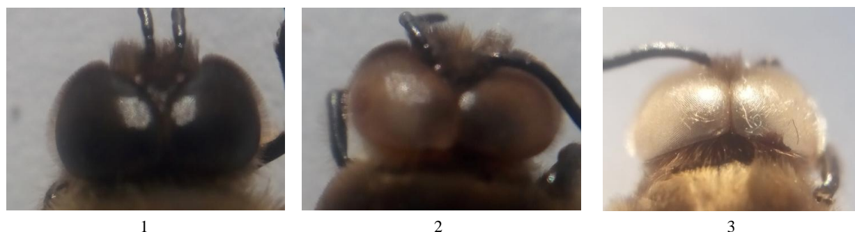
Figure 2 – Morphological anomalies of the eyes of drones: 1 - normal eyes; 2 - brown or pomegranate eyes; 3 - white eyes

In numerical ratio, the maximum number (33.0%) of drones with brown or pomegranate eyes was registered in the forest-steppe area (Table 2). Also, one drone with white eyes (0.3%) was recorded in the apiary of this territory. In the steppe and forest honey flow areas, drones with only brown or pomegranate eyes were observed - 12.8% (steppe zone) and 26.3% (forest zone).