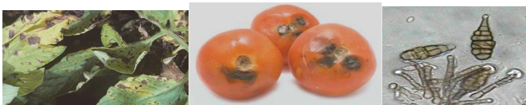
Figure 2 - Type of disease Alternariosis and conidia Alternaria alternate

On July 25, 2019, diseases of tomato microorganisms were detected at the Babaykurgan field plot: late blight, alternariosis and verticilliosis (table 5). The highest degree of infection with viral diseases, alternariosis was the Rio Grande variety (the ratio of prevalence for viral diseases – 20.0/4.0%, alternariosis-33.3/2.7), and late blight - the Novichok variety (13.3/2.7%). Both varieties are equally damaged by verticilliosis (6.7 / 1.3%). On August 7, 2019, tomatoes were affected by viral diseases, alternariosis, verticilliosis and apical rot (fig.2-3).