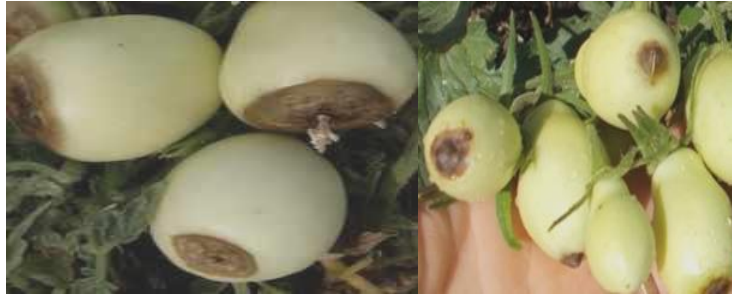
Figure 1- Bacterial disease of apical rot of the Novichok breed

Resistance of vegetable crops to diseases is one of the most important characteristics of the variety. The quality of vegetable products depends on this. Phytopathological analysis of vegetable plants revealed viral, bacterial and fungal diseases. As can be seen from table 7, the varieties of vegetable crops studied affect both viral and fungal diseases. During the growing season until the second half of August, hot and dry weather prevailed, so in early August there was a high degree table-4 defeat of tomato varieties by types of diseases.