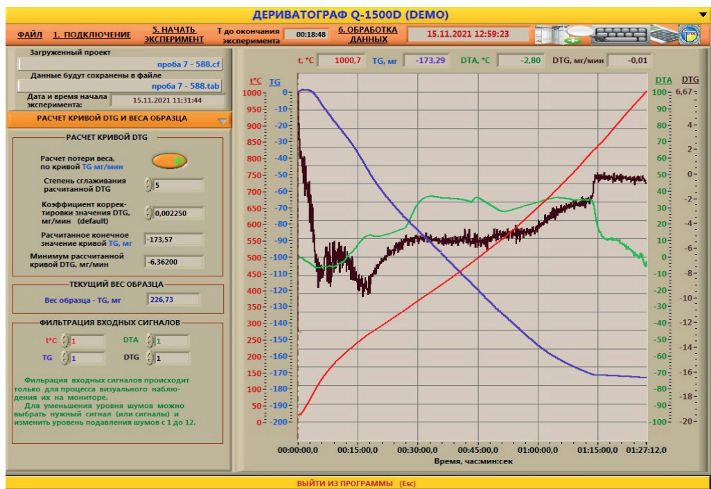
Рисунок 2. Кривые дифференциальный термического анализа (ДТА), термогравиметрического (TG) и дифференциальный термогравиметрического (DTG) анализа образцов диатомита ТОО «Арай»

Дополнительную информацию о процессах, происходящих при нагреве, получили при анализе кривых ТГ и ДТГ. Количественное определение изменения массы проводили по кривым ТГ (рис. 2).