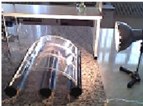
Figure 3 – Overview of the developed solar energy system made of translucent coverings for intensifying the evaporation of wastewater and trapping harmful substances

It will enable you to reduce the level of air and soil pollution, speed up the evaporation process, and use polluted water purified by distillation in the irrigation system of urban trees and shrubs in conditions of water deficiency.