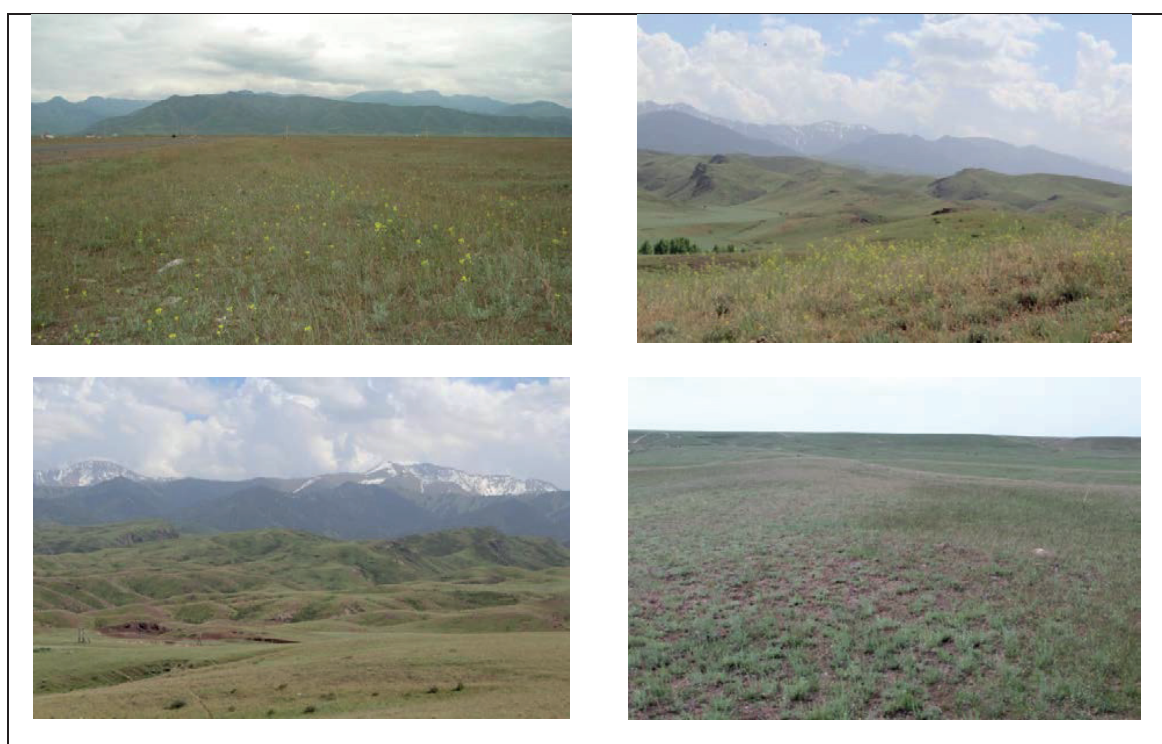
Figure 1 - Desert vegetation of the Ketpen-Temerlik ridge.

The following tasks were set: to carry out a taxonomic, biomorphological, geographical analysis of the halophilous floristic complex of the Ketpen-Temerlik ridge.