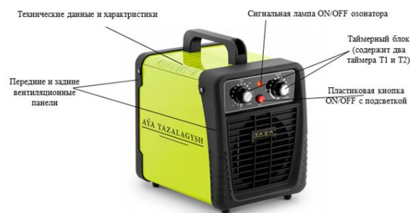
Рисунок 3 – Внешний вид озонатора AUA TAZALAGYSH –01

Внешний вид озонатора и его передней и задней панелей приведен на рисунке 3. Сам каркас озонатора изготовился из листа алюминия толщиной 0,4 мм. Передняя и задняя пластмассовые панели и другие детали выполнены из пластикового материала PETG на 3D-принтере.