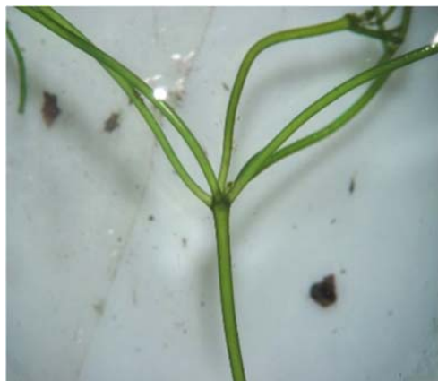
Figure 2 – Chara algae: Nitellopsis obtusa (Desvaux) J.Groves

This is a relatively common species. Next, after studying 3 samples taken from Pond - 2 pond, here is 1 species of chara algae; Chara contraria var. schaffneri (A.Braun) the Raam type was determined - one house plant. Length 15-35 cm. Very delicate. The number of rings on the stem is 16 pieces. The leaf length is 4 mm. This species is also found in the waters of Southern and Northern Kazakhstan (figure 3).