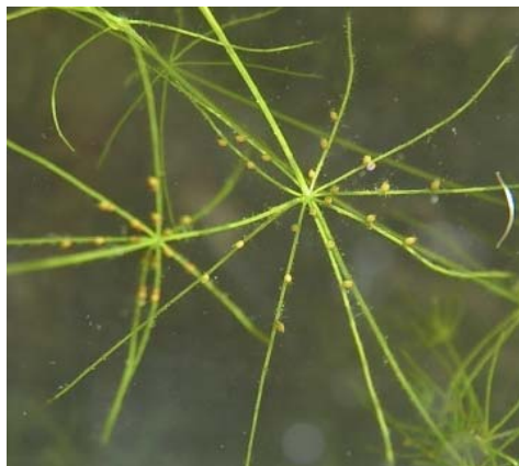
Figure 1 – Chara algae: Chara fragifera Durieu de Maisonneuve