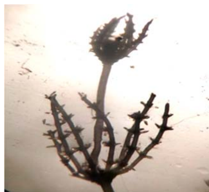
Figure 4 – Chara algae: Chara uzbekistanica Hollerbach

And the fourth object is the pond - 3, studying 3 samples taken from the pond, here is Nitellopsis obtusa (Desvaux) J.Groves and Chara uzbekistanica Hollerbach it was found that there are 2 species of chara algae. After studying 4 samples taken from the pond - 3 pond, there are 2 species, Chara uzbekistanica Hollerbach-two houseplants. Mutovka has an add-on. The leaves are longer than the oogoni. Stems with thorns (rare). (figure 4.), Nitellopsis obtusa (Desvaux) J. Groves the types are defined. Thus, 4 species of chara algae were identified from 5 research objects. Studying the materials obtained for the study, we found that high-level aquatic plants with chara algae: sea Naiad ( Najas marina L.) Urut spikelet ( Myriophyllum spicatum L.), and green algae were identified. On the coast, the common trowel ( Phragmites australis (Cav.) Trin. Ex Steud. Auct.) and rogoz narrow-leaved ( Typha angustifolia L.) met.